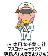
JR 東日本千葉支社 マスコットキャラクター 駅長犬(えきちょうけん)