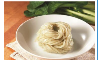
【ふなばし産品ブランド協議会】

創業明治 45 年の長い歴史を持ち、千葉全域から美味しい海苔を仕入れて、歯切れと旨味で選別されたものを提供します。その他、フレーバー付きの様々な味を楽しめる海苔も販売します。