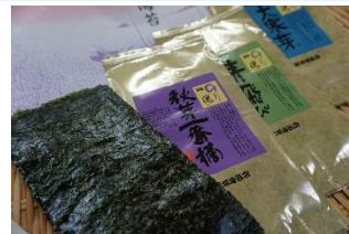
【株式会社飯塚海苔店】

バリスタの世界チャンピオン「粕谷哲」が監修した厳選コーヒーです。『JR 東日本おみやげグランプリ 2020』飲料部門賞を獲得しました。