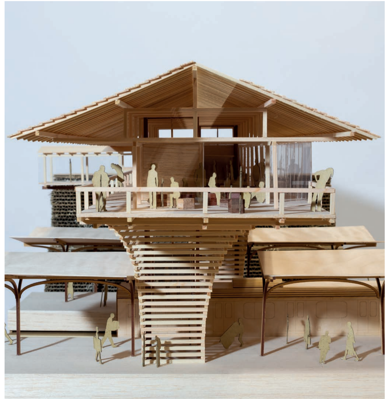
橋の上はマイノリティのためのカウンセリングスペースになっており、優しい光の差し込む切妻屋根が覆いかぶさる。 Gentle lights pouring down from the gable roof covering the space above the bridge where counseling space for the minority is located.