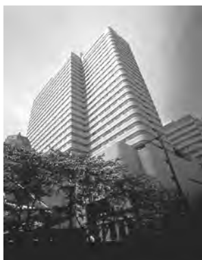
利用補助施設 「ホテルメトロポリタン(池袋)」