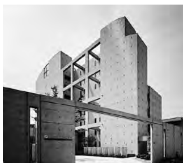
寮「ドルミエール大塚」