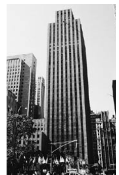
ニューヨーク事務所 （1964年1月開設）