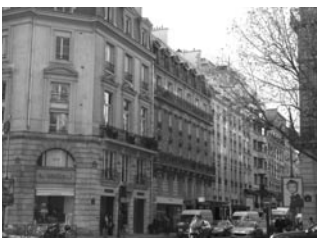
パリ事務所（1965年6月開設）