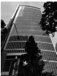
シンガポール事務所 （2013年3月開設）