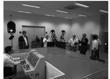
ロシア鉄道による総合研修センター視察