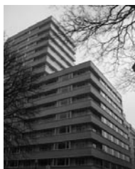
ブリュッセル事務所（2012年11月開設）