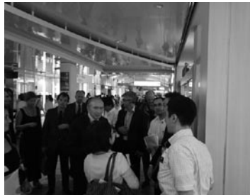
フランス国鉄によるエキナカ視察（品川駅）