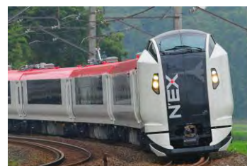
N'EX 東京去回車票有效範圍