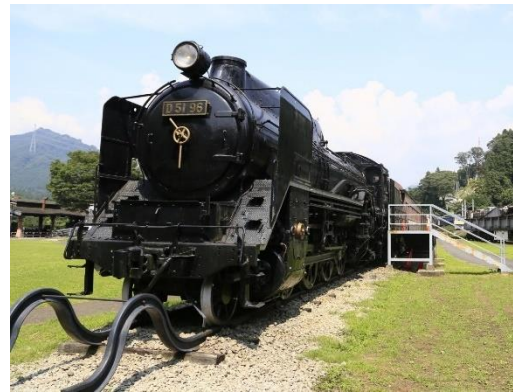
【SL D51 96】