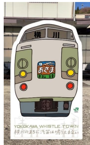
【列車イラストイメージ】