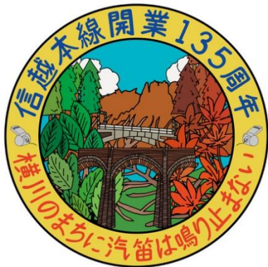
【記念ヘッドマークデザイン】

2021年2月6日(土)に「碓氷峠鉄道文化むら」に展示されているSL D51 96に記念ヘッドマークを掲出いたします。