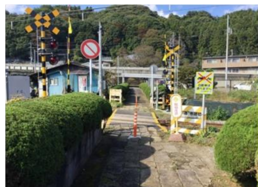
吾妻線 善道寺踏切の第1種踏切時