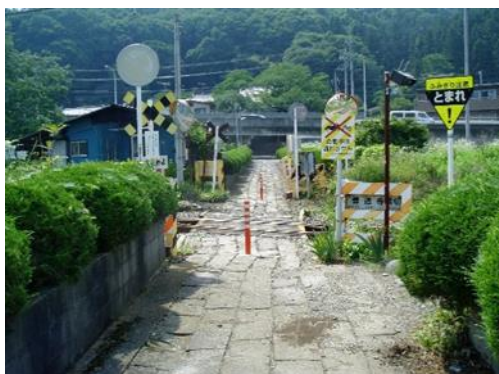
吾妻線 善道寺踏切の第4種踏切時