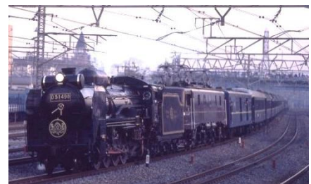
【30 年前オリエント急行けん引】