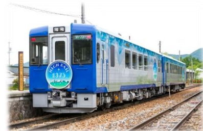
〈HIGH RAIL 1375〉