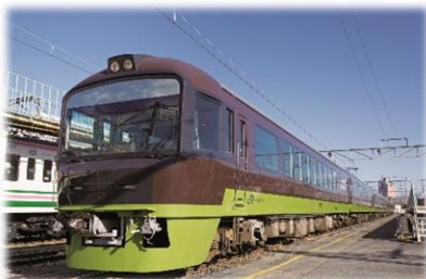
〈リゾートやまどり〉