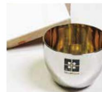
コースの一例 (越乃Shu*Kuraオリジナルお猪口)