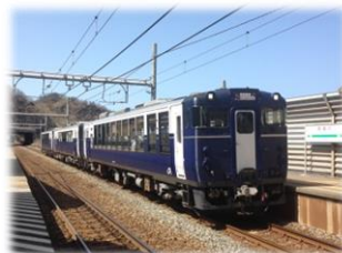
〈越乃Shu * Kura〉