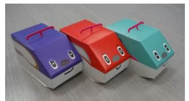
とれたんずペーパークラフト

はさみとのりを使って作る新幹線のペーパークラフト。 のりだけで簡単に作れる「とれたんず」のペーパークラフトもごさいます。