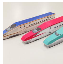
新幹線ペーパークラフト

深谷駅構内1階市民ギャラリー1において、新幹線ペーパークラフト、塗り絵、SLかるた大会などをおこないます。