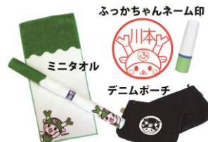
ふっかちゃんグッズ