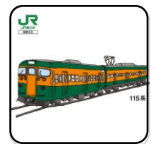
【オリジナルハンドタオル】