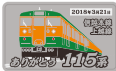
【記念ミニプレート(金属製)】