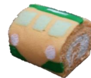
【115系生ロールケーキ】