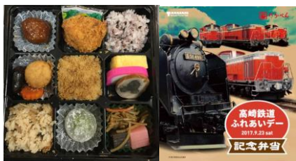
【高崎鉄道ふれあいデー記念弁当】