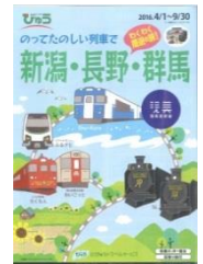
「びゅう」パンフレットイメージ

北陸新幹線や上越新幹線と「のってたのしい列車」を乗り継ぎ、沿線の観光や温泉をお楽しみいただける多彩なコースを設定しました（日帰りコース・1泊2日コース）。しなの鉄道「ろくもん」を使ったコースも設定し、乗っても楽しい、降りても楽しい、魅力のぎゅっと詰まったご旅行をお楽しみいただけます。「びゅう」専用パンフレットを作成し、首都圏のびゅうプラザを中心に宣伝を展開します。