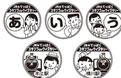
(参考) スタンプデザイン