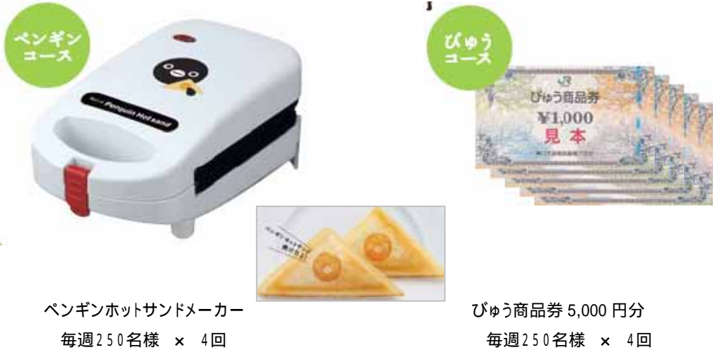
ペンギンホットサンドメーカー 毎週 250 名様 × 4 回

抽選は、エントリーしていただいた Suica の利用実績 (週 3 回なら 1 口、週 6 回なら 2 口) に応じて、自動で行われます。