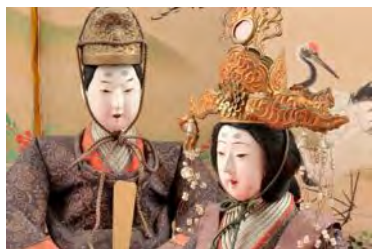
北前船で運ばれた雛人形

東日本エリアにも多くの地域に「雛祭り」文化が残っています。この旅では、色濃く雛の文化が残る酒田（山形県）に北前船で運ばれて大切に保管されてきた雛人形を見ながら雛巡りをいたします。翌日は、宮沢賢治の描いた「イーハトーヴ(理想郷)」の世界を、SL 銀河を貸し切ってお楽しみいただきます。3日目は那須（栃木県）で朝食の後、結城（茨城県）にて結城紬の文化に触れていただきます。