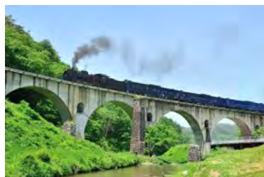
宮沢賢治の世界が広がる SL 銀河