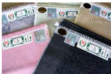
奈良時代から続く織物 結城紬