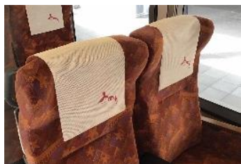
「リゾートみのり」座席ヘッドカバー (未使用品) 100 名様