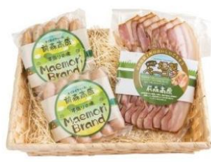
前森高原手造りウインナー セット 20 名様