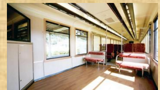
イベントスペース