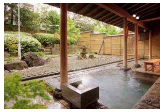
陸羽東線沿線の温泉宿 ペア宿泊券 10 組 20 名様

※詳細は専用サイトをご確認ください(2020年4月中旬頃掲載予定) https://jr-sendai.com/train/minoritrain/thankyouminorit/