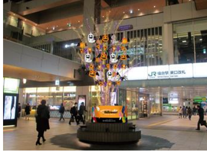
【ツリー装飾 (位置図: ㊹)】※初