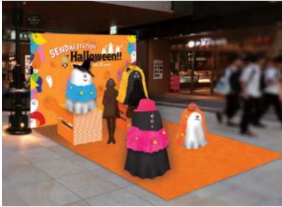
【フォトスポット (位置図: ㊸)】