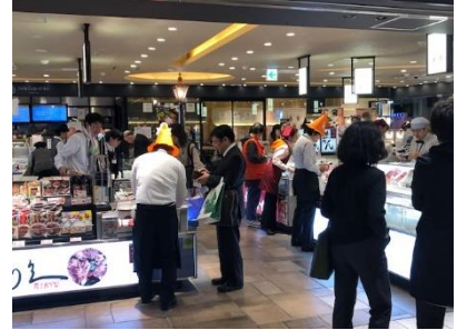
【店舗スタッフ仮装イメージ】