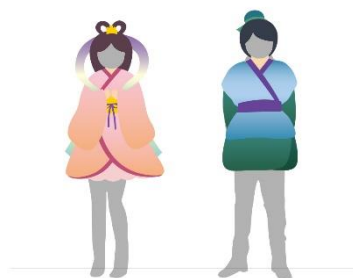
【織姫・彦星顔出しパネル】