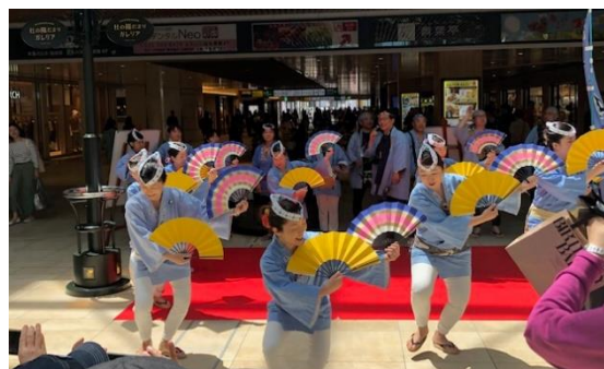
【すずめ踊りイメージ】