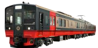
フルーティアふくしま