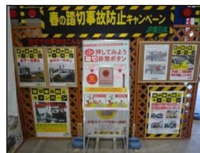
【キャンペーン・ブースの設置】