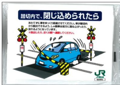
【ポケットティッシュ】