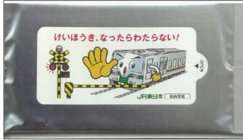
【冷感ウェットティッシュ】