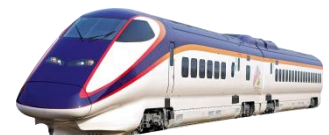
山形新幹線 E3系 (イメージ)

・東京駅内で80店舗以上が揃う「グランスタ」と、カフェやレストラン・ファッションアイテム店舗が集う新エリア「グランスタ丸の内」でお食事やお買物をお楽しみいただける共通利用券(1,000円分)付。