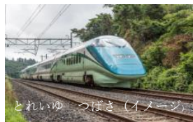
とれいゆ つばさ (イメージ)