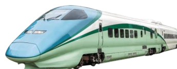
とれいゆ つばさ (イメージ)