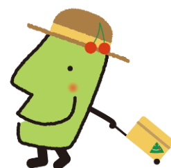
山形県おもてなし課長 「きてけろくん」