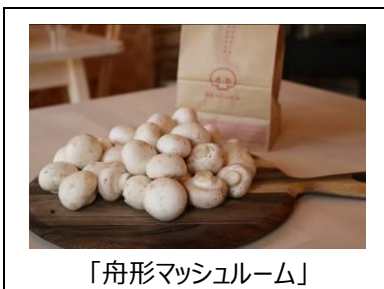
「舟形マッシュルーム」

肉厚で大きく歯ごたえがあるのが 特長。さっと茹でて刺身のように 食べるのもおすすめです。