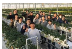
山元いちご農園(株)