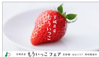
【トレインチャンネルイメージ】

宮城県内に加え、首都圏の駅・車両においても、トレインチャンネル・中ぶり広告・ポスターにより、「もういっこ」をPRします。