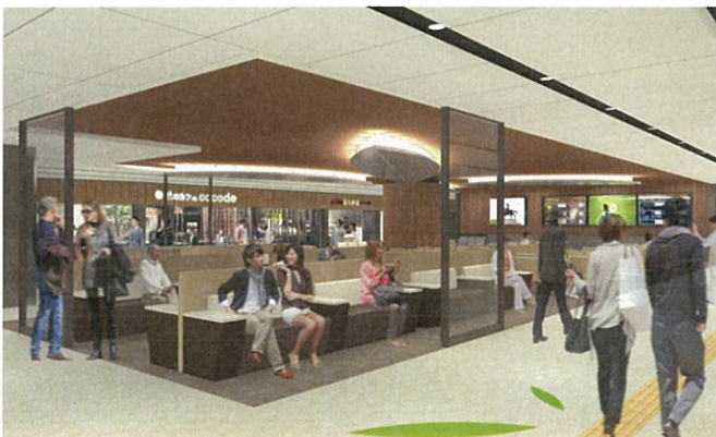
待合室完成イメージ

待合スペースが広くなりご利用しやすくなるとともに、東北各地の祭で使用されるアイテムの展示を行い、東北の魅力を発信していきます。（12月15日（金）より）