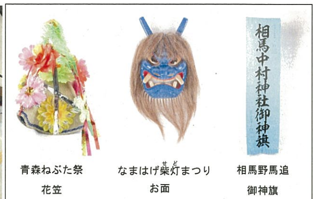
青森ねぶた祭 花笠