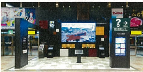
ヨリ未知ポータル大型モニター