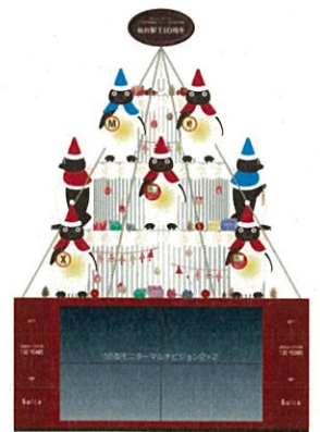
Suicaのペンギンツリーイメージ