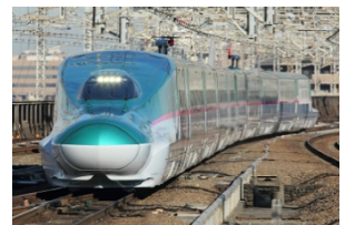
東北新幹線 E5 系(イメージ)