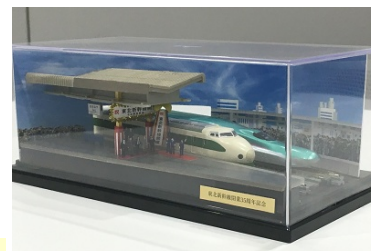
ジオラマディスプレイ 実物とはデザインが異なります

東北新幹線開業 35 周年を記念して JR 東日本と鉄道模型メーカー KATO がコラボレーション。模型の世界で新旧新幹線の並列を再現！