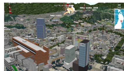
デジタル版鉄道・観光ジオラマ