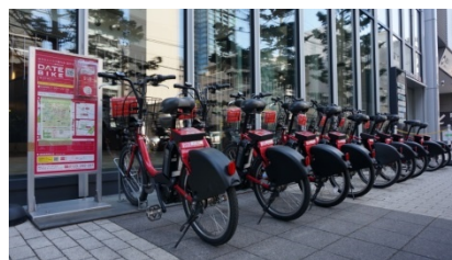
サイクルポート （仙台トラストシティの例）