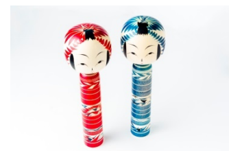
伝統工芸品の展示例