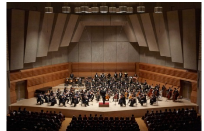
仙台フィルハーモニー管弦楽団