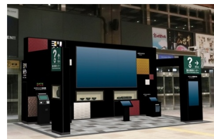
ヨリ未知ポータル