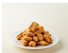
仙台きなこおかき