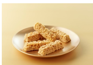
仙台きなこクランチ