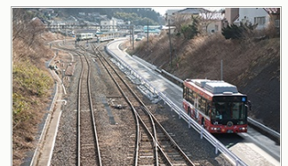
BRTと大船渡線との併走区間

北は八戸市から南は石巻市まで、三陸沿岸の各市町村協力のもと、おいしい春の味覚が盛りだくさんの三陸をご紹介します。気仙沼線、大船渡線で運行中の「BRT」に関する情報や各地を走るイベント列車などの三陸沿岸への旅行商品パンフレットなど、三陸へのおでかけ情報が満載です。BRT沿線復興キャラクター「おっぼくん」やかわいいご当地キャラクターも登場して、会場全体を盛り上げます。