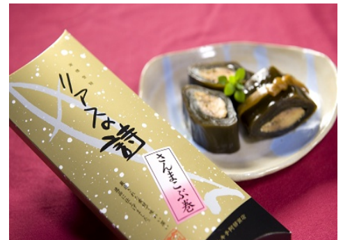
リアスの詩(女川町)