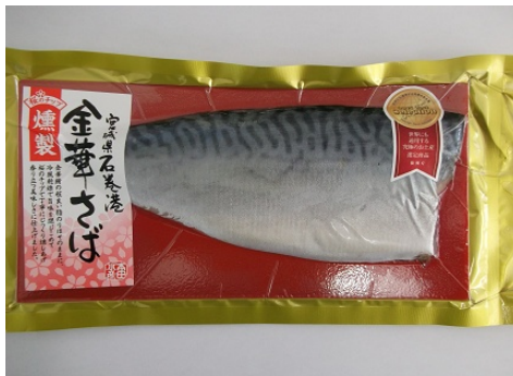
金華さば燻製(石巻市)