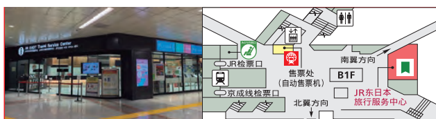
成田机场(成田机场第1候机楼)

可以从位于成田机场第1候机楼及成田机场第2·第3候机楼内的JR东日本旅行服务中心、JR售票处(Midori-no-madoguchi)、护照读取器的指定座席售票机购买。