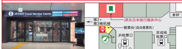
机场第2大楼(成田机场第2·第3候机楼)