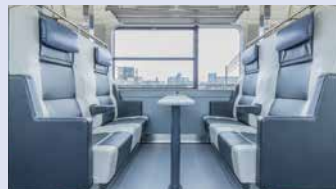
みんなでくつろげるボックス席。