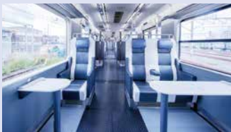
車内スペースをゆったりと確保。

愛車とともに、快適に目的地へ。大切な仲間や愛車と過ごせる車内は、サイクリスト達の心地よい移動基地となります。