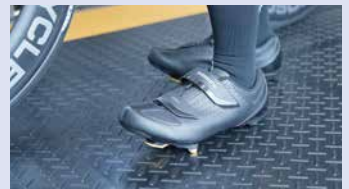
ビンディングシューズでも滑りにくい床。