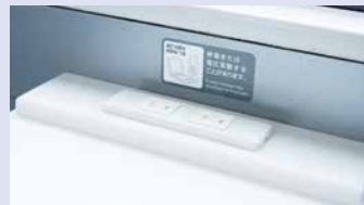
コンセントでモバイル等の充電が可能。