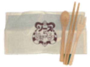
ソース×リョーモー オリジナルカトラリー

SNSに投稿する際、ハッシュタグに「#ソースリョーモー」を入れて投稿してください。