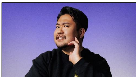
さもあんすがい氏