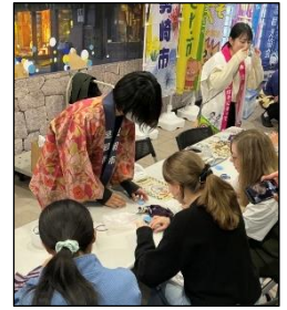
くるみボタン作りの様子