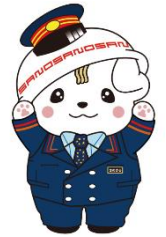
佐野ブランドキャラクター さのまる©佐野市