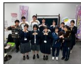
あしもり隊 sanoteens (さのていーんず)