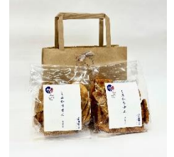
< 小袋しみかりせん >

寒河江市を拠点とする紡績・ニットメーカー佐藤繊維株式会社の セレクトショップ<GEA>と山形せんべい・あられ専門店<煎餅工房さがえ屋>の コラボレーション商品です。人気のしみかりせん醤油味と七味唐辛子味を 食べきりサイズで1袋ずつ詰め合わせています。