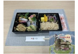
< ざわせん弁当 >

地元の旬の食材を使用し、丁寧に仕上げたオリジナル特製弁当です。 沿線の景観や伝統文化、特産品をイメージした掛け紙に包み、料亭ならではの味わいが楽しめる一折です。