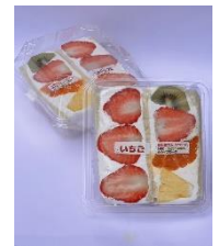
< フルーツサンド >

青果店ならではの素材選びにより、果物本来の味わいを活かした2切入りの 商品です。