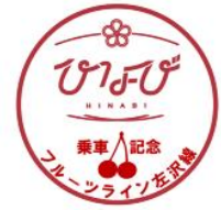
<スタンプデザイン>