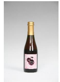
< さくらんぼスパークリング >