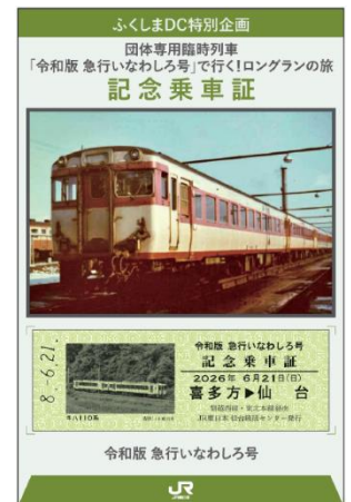
【記念乗車証イメージ】