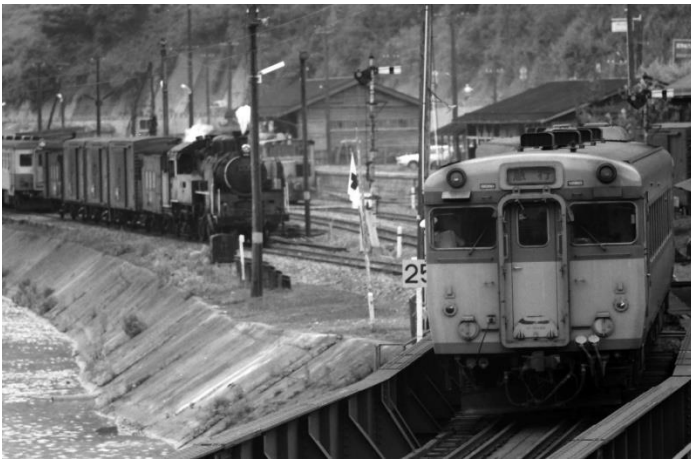
(只見線 会津川口駅にて撮影)