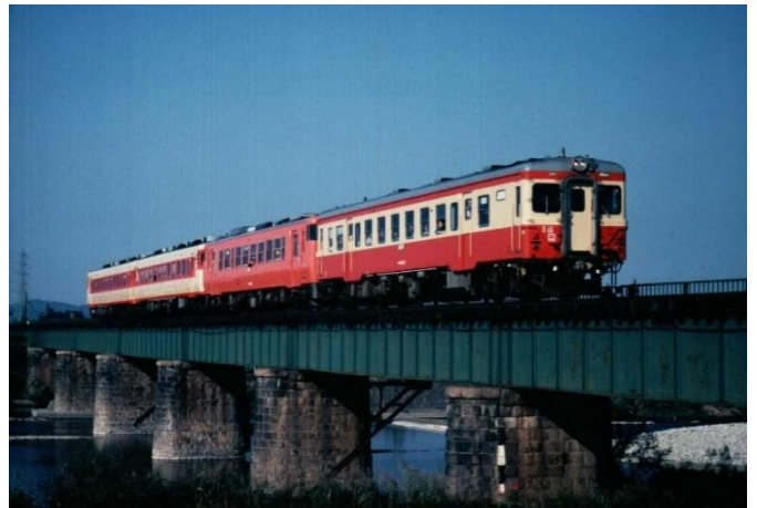
(磐越西線 五泉～猿和田駅間にて撮影)