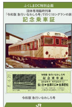
【記念乗車証イメージ】