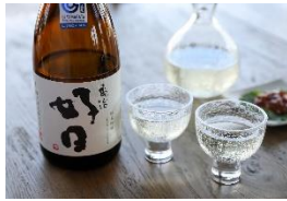
鯉川酒造 亀治好日