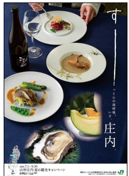
酒田フレンチ (酒田市) と庄内の旬の食材