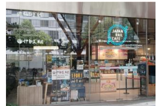
JAPAN RAIL CAFE