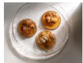
「常磐もの」煮凝り各種 株式会社おのざき