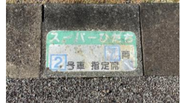
スーパーひたち号 乗車位置標