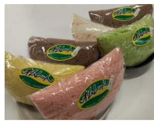
オムレット (小野町)