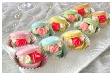
フラワーマカロン (郡山市)