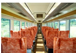
2号車リクライニングシート