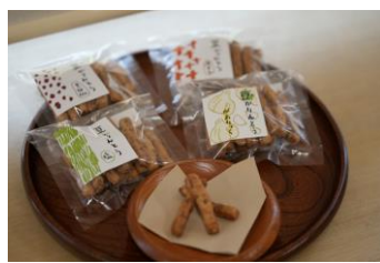
豆かりんとう (三春町)