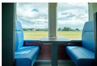
4人ボックスシート