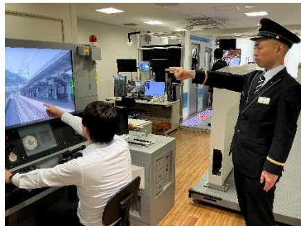
【運転士・車掌シミュレータ連動の様子】