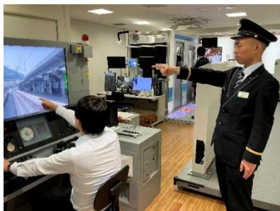
【現役乗務員が付き添いでレクチャー】