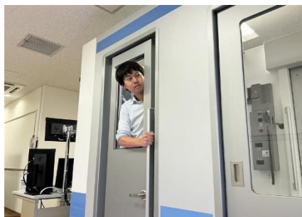
【ドア開閉操作体験】