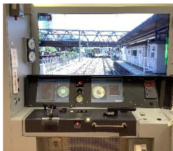
【ツーハンドルの運転台】

*車のアクセルに相当するマスコンとブレーキに相当するハンドルが分かれている運転装置。