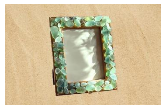
フォトフレーム(イメージ)