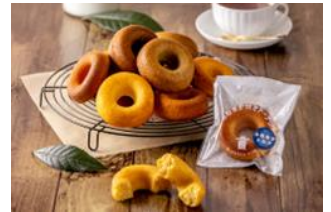
みねおか焼きドーナツ