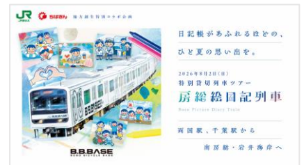
「房総絵日記列車」商品イメージ

※お申込みは C-VALUE 会員さま限定となります。(お申込み時に C-VALUE 会員登録が必要となります。)