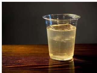
②Mixology Bar Bamboo