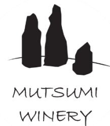
④むつみワイナリー