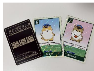
『TRAIN CARD GAME』a版