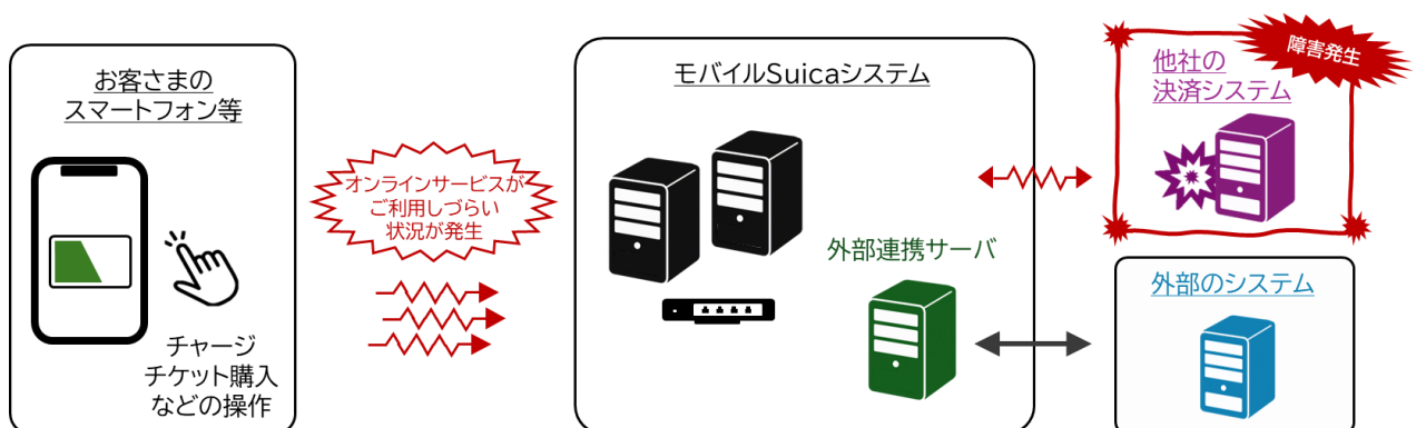
6月30日に発生した事象のイメージ