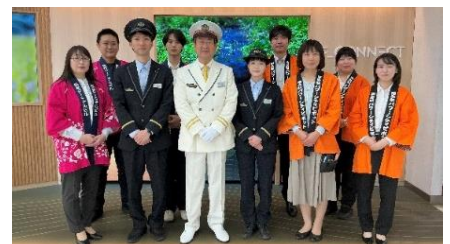
※各駅と駅商業施設担当者（左より市川駅、本八幡駅、福島駅）