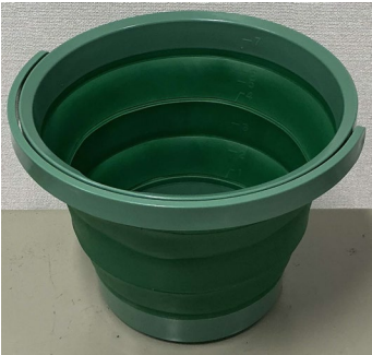
8Lサイズ (間口32.8cm 高さ4.8cm)