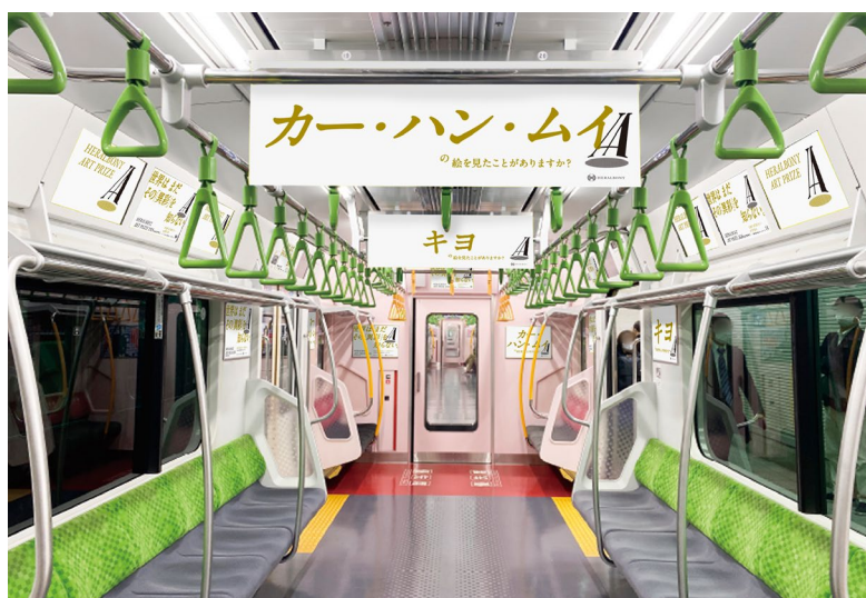
車内ラッピングイメージ