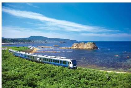
リゾートしらかみ

商品詳細： https://link.jrview-travel.com/ir257