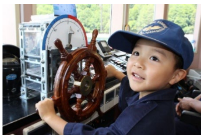
奥只見湖遊覧船 船長体験

商品詳細： https://link.jrview-travel.com/qfkw8