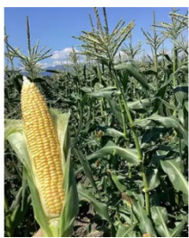
あぐりーむ昭和 とうもろこし収穫体験

家族みんなで楽しめる群馬の味覚体験バスツアーです。高崎駅を出発し、昭和村の「道の駅 あぐりーむ昭和」へ。旬のとうもろこし収穫体験は、お子さまにも大人気！採れたて野菜のお買い物も楽しめます。