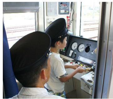
えちぜん鉄道・電車運転体験