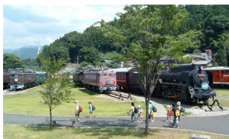
碓氷峠鉄道文化むら

ここでしか出会えない貴重な車両が30両以上も展示されている「碓氷峠鉄道文化むら」では、ガイド同行で園内を巡ります。