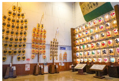
秋田市民俗芸能伝承館 ねぶり流し館