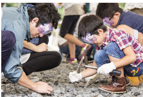
かつやま恐竜の森・化石発掘体験

商品詳細: https://link.jrview-travel.com/ttc6q