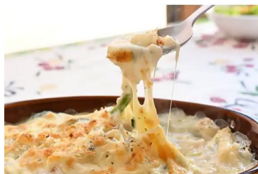
奥利根ワイナリーレストラン お食事一例

午後は道の駅川場田園プラザで自由にショッピングと散策を楽しみ、高崎駅へ戻ります。