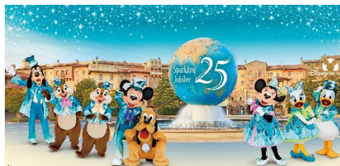
フォトスポットのイメージ

※詳細は東京ディズニーリゾート・オフィシャルウェブサイトにて 決まり次第お知らせします。