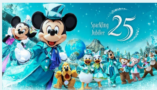
「東京ディズニーシー25周年 “スパークリング・ジュビリー”」

https://www.tokyodisneyresort.jp/treasure/tds25th/