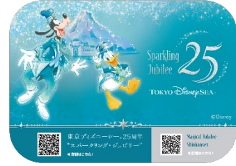
車内ステッカーのイメージ

今回の「Magical Jubilee Shinkansen」は、さまざまな海の魅力から着想を得た東京ディズニーシー25周年のテーマカラー「ジュブリーブルー」を基調に、アニバーサリーイベントの特別な衣装に身を包んだミッキーマウスやディズニーの仲間たち、そして東京ディズニーシーのシンボルでもあるディズニーシー・アクアスフィアやプロメテウス火山などが描かれ、東京ディズニーシー25周年の祝祭感を表現した特別な車両です。車内においても、座席の枕や車内メロディなどで「東京ディズニーシー25周年“スパークリング・ジュブリー”」の雰囲気を感じることができます。特別車両「Magical Jubilee Shinkansen」で、祝祭感あふれる新幹線の旅をお楽しみください。