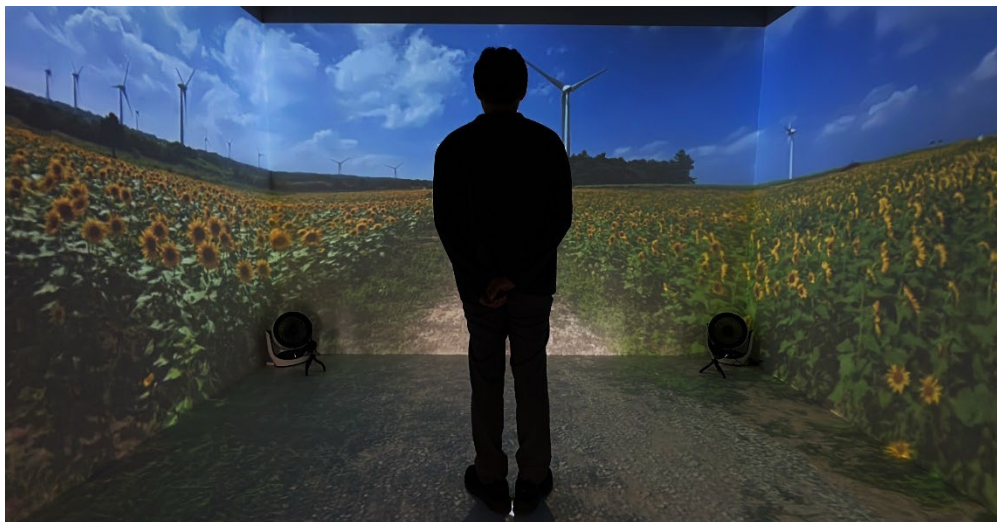
没入体験イメージ（郡山布引の風の高原の様子）