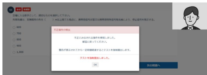
他人の受講・居眠り防止